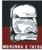
Association Moruroa e tatou (Polynésie)