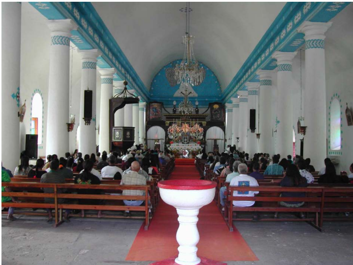
Un des derniers offices dans la cathédrale Saint-Michel en octobre 2005.

La visite du Délégué à la sûreté nucléaire aux anciens sites du CEP a permis un éclairage un peu plus appuyé sur ces îles "du bout du monde" que représente l'archipel