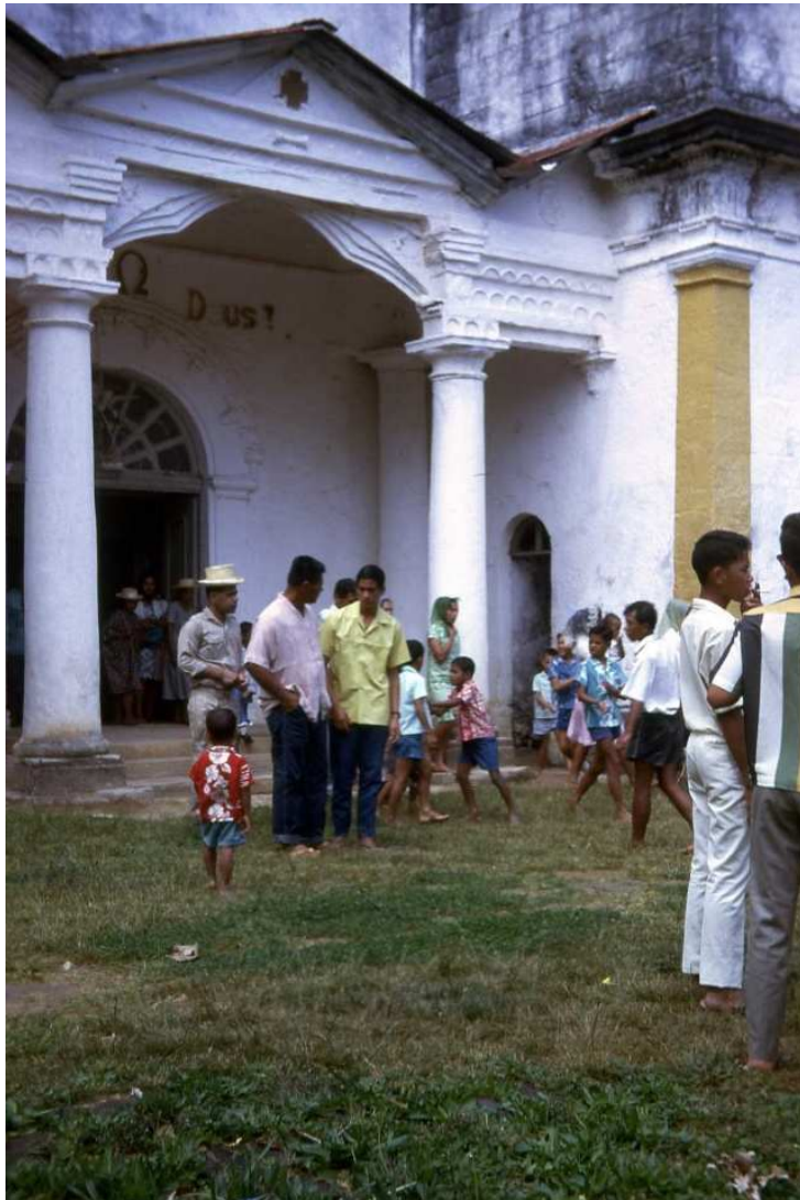
Une sortie de messe à Rikitea en 1970

Pour les Mangarévien, la cathédrale Saint Michel de Rikitea est donc, à son niveau, ce que représenterait Notre-Dame de Paris pour les Français. Toujours très croyants, les habitants de ces îles ont gardé très vivante la foi héritée de l'époque des missionnaires du XIX ème siècle. Leur église n'est pas seulement un « monument historique », c'est surtout le lieu de prière quotidien de la communauté catholique qui se confond avec la quasi-totalité de la population des Gambier.