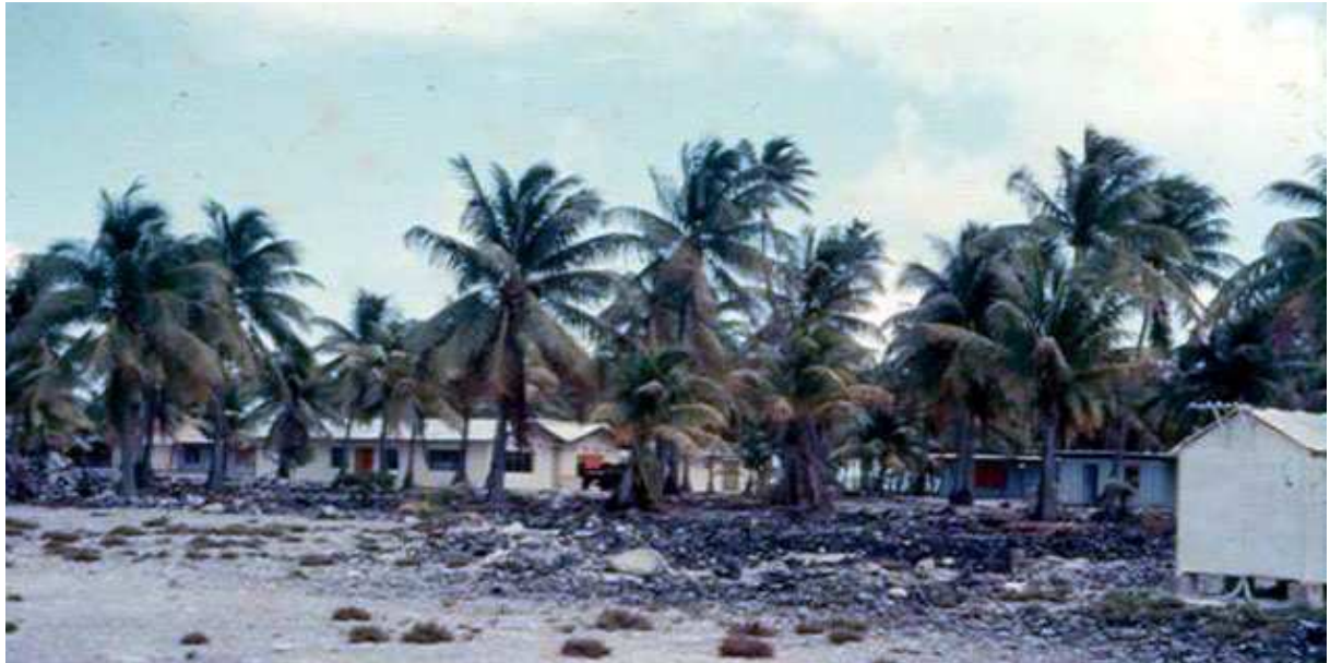
La base vie de Tureia au début des années 1970.

Pour ce tir Encelade personne n'a été prévenu de retombées radioactives, donc